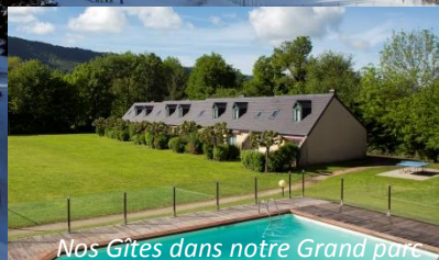
Nos Gîtes dans notre Grand parc