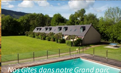
Nos Gîtes dans notre Grand parc