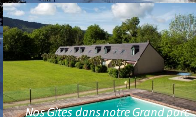
Nos Gîtes dans notre Grand parc