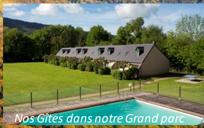
Nos Gîtes dans notre Grand parc